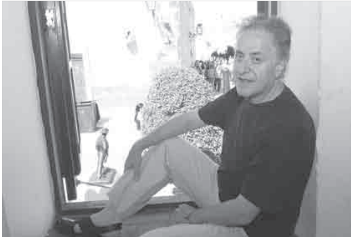
Herencia. Se considera tributario de una tradición poética que unió la búsqueda formal y la interpelación de la realidad.

curso homogéneo establece una apuesta a la imaginación y como la poesía es carba con preguntas, quizás allí la gente encuentre un refugio diferente donde mirarse. Aparte nunca perdió su búsqueda experimental ni su mirada crítica. Yo me considero heredero de una tradición poética que unió la búsqueda formal y la interpelación de la realidad. Es decir lo estético y lo ético. La poesía le hace un reportaje a fondo a la realidad, en la selva Palma Real también aparecen desaparecidos: hay un bosque talado, y la poesía se pregunta qué pasó con los árboles. Yo no quie-